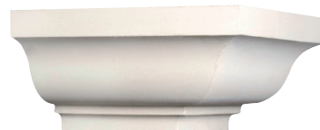
Corniches angle sortant