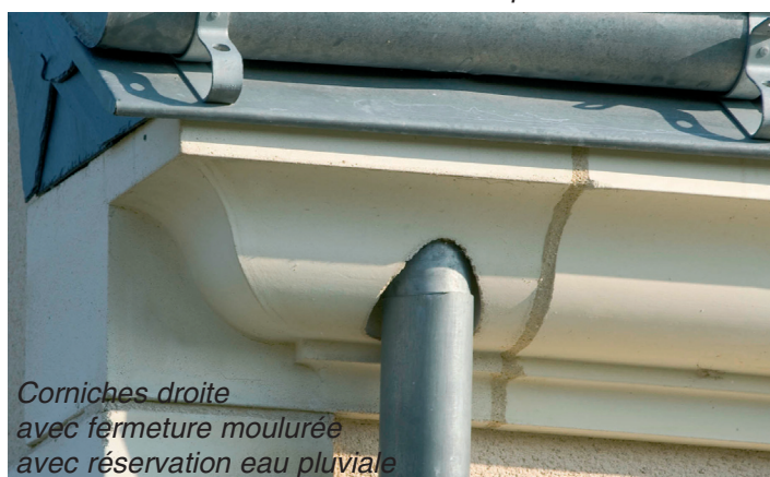
Corniches droite avec fermeture moulurée avec réservation eau pluviale