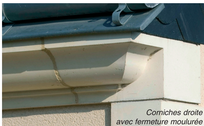
Corniches droite avec fermeture moulurée